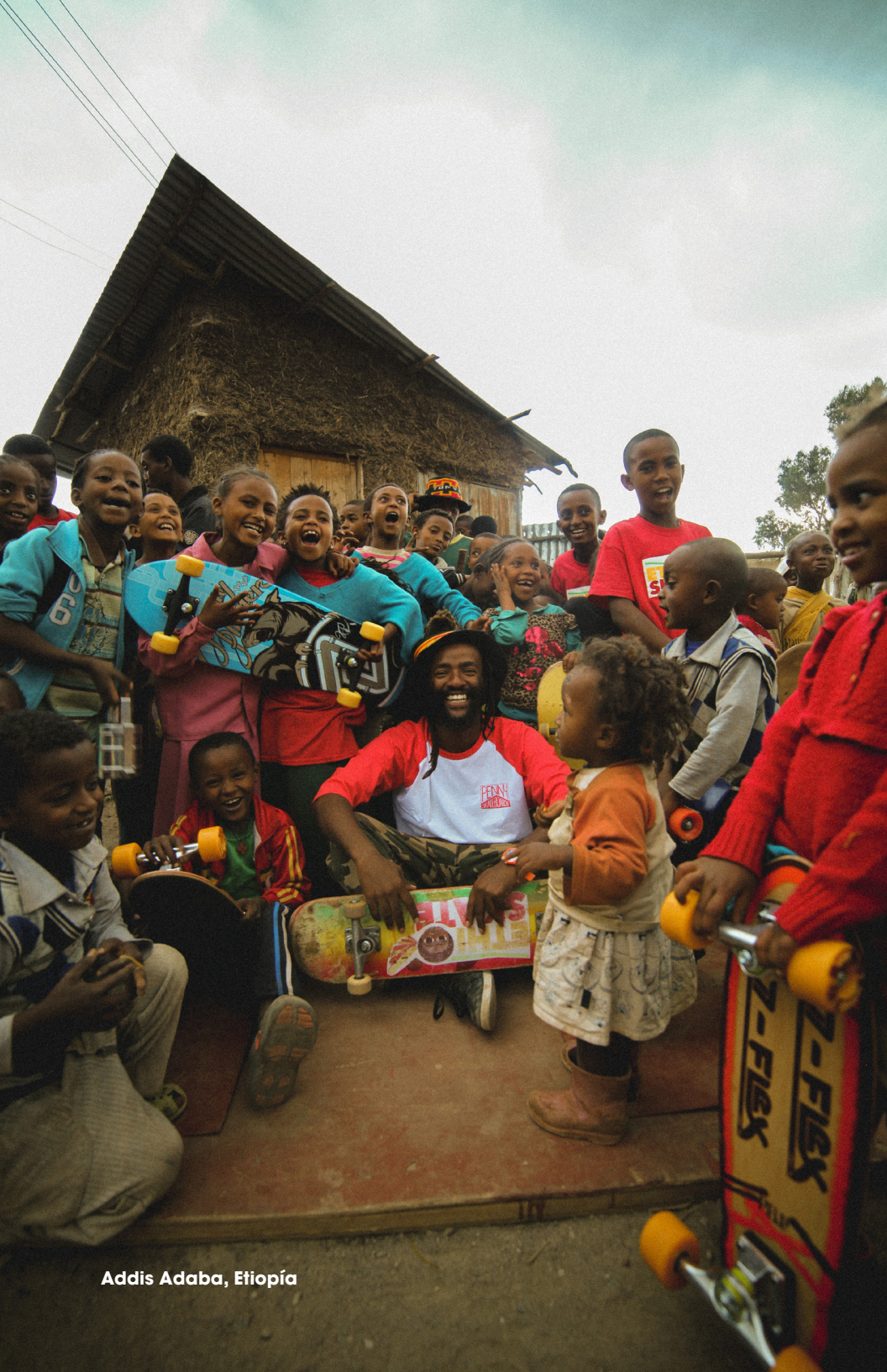
Addis Adaba, Etiopía