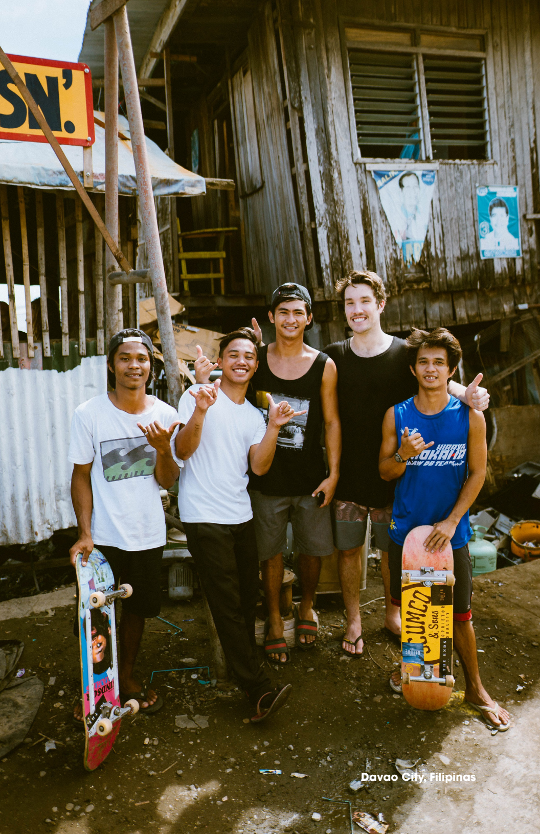
Davao City, Philippines