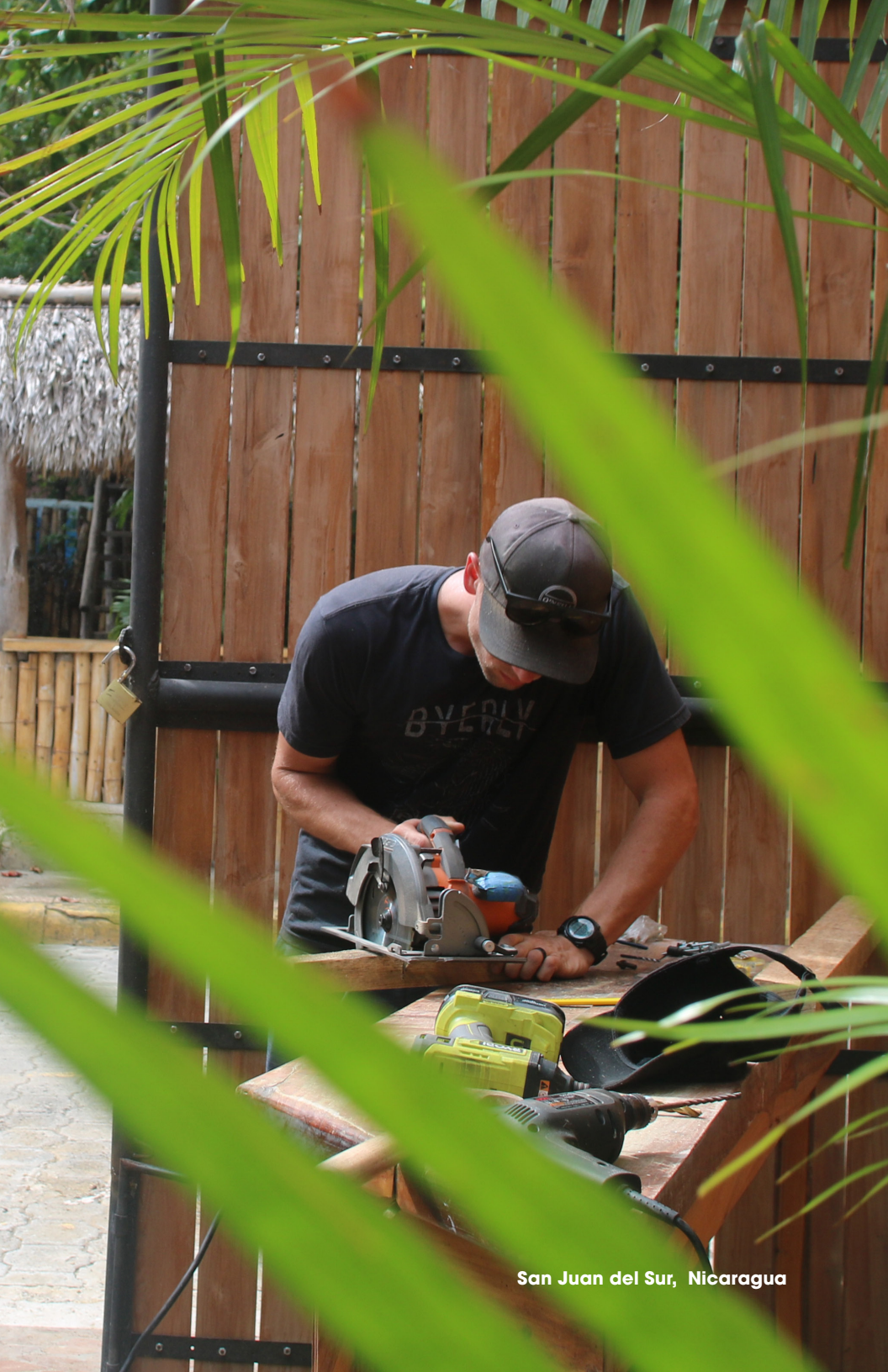
San Juan del Sur, Nicaragua